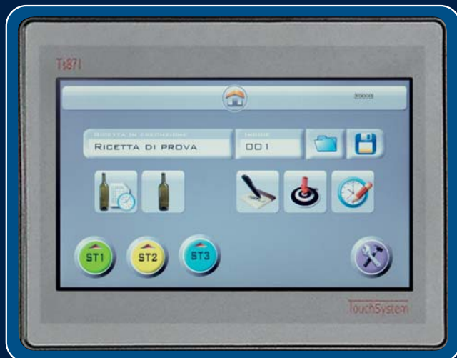
PROGRAMMATORE DI LAVORO TOUCH SCREEN TOUCH SCREEN WORK PLANNER

PER UNA MIGLIORE ORGANIZZAZIONE DEL LAVORO, A RICHIESTA: FOR A BETTER WORK PLANNING, UPON REQUEST: